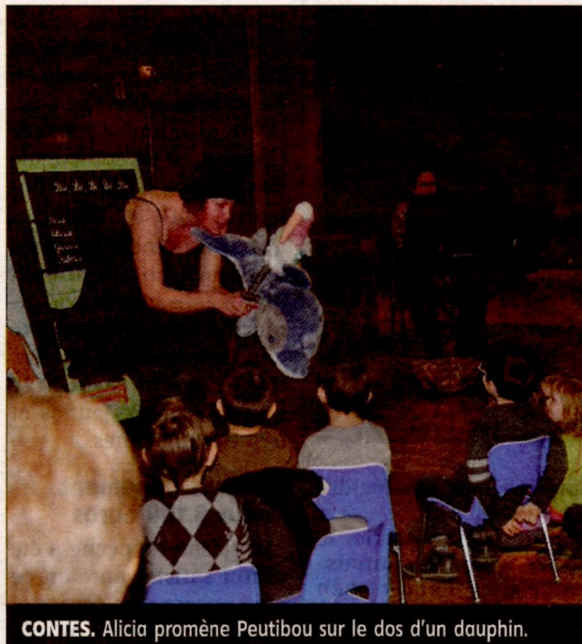
CONTES. Alicia promène Peutibou sur le dos d'un dauphin.

Peutibou est un jeune marabout. Sa première journée de promenade dans les marécages va lui réserver des surprises. Il trouve des amis, il se fait quelques frayeurs. La nuit tombée, il se perd, mais